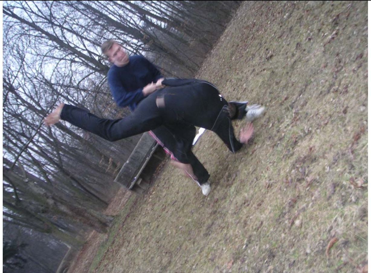
Bei entsprechender Fallschule macht auch das Hebeln gleich viel mehr Spaß.