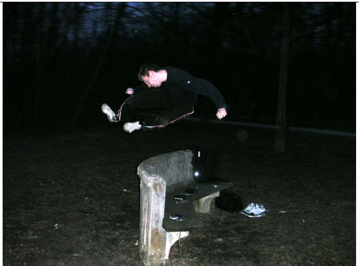
Action pur © zwischendurch mal ein doppelter Tymio Yop ch'agi (Tritt Nr. 3 gesprungen, beidbeinig). Und weil sie so schön ist, schauen wir uns die elegante Bank halt von oben an!