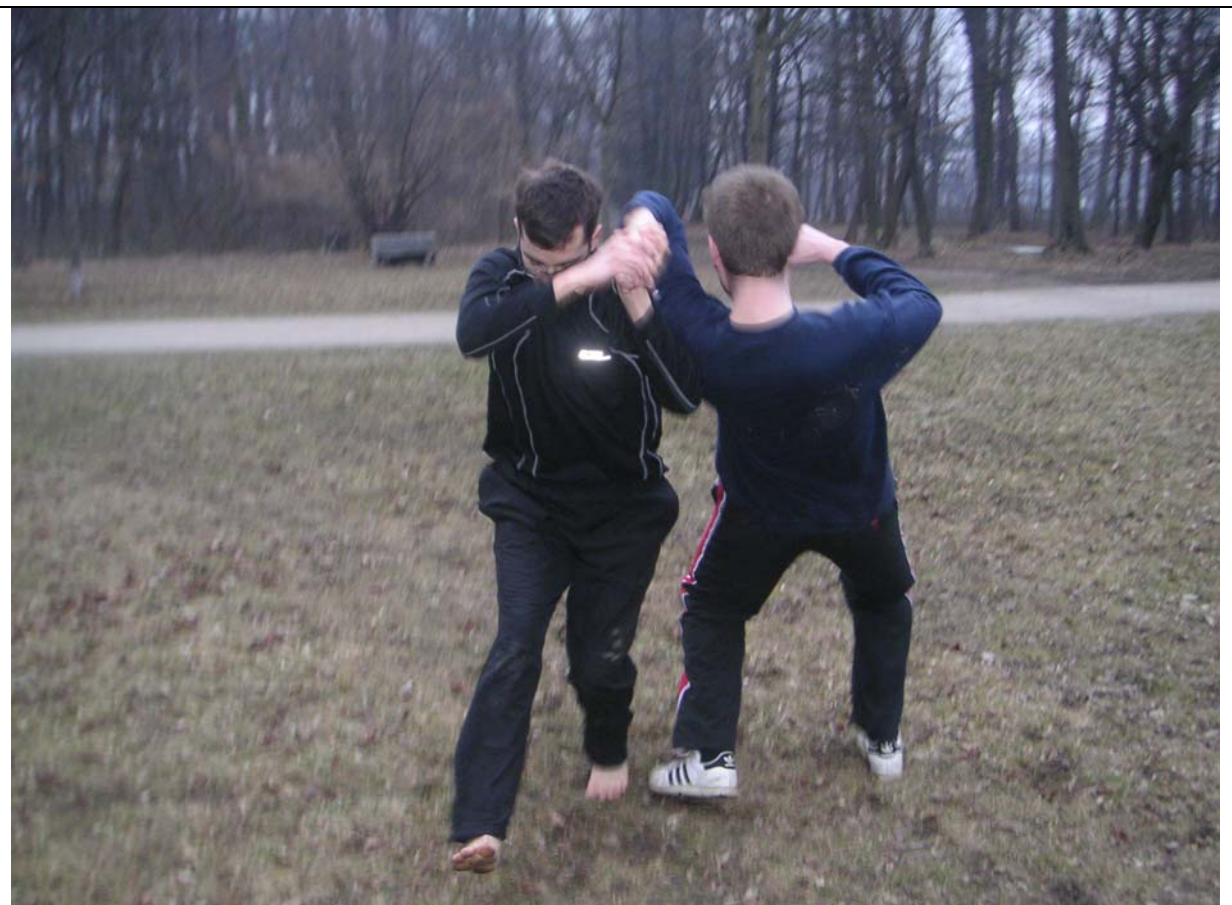
Hebel 1, 9.Kup – und gleich wird der Boden getestet... Man beachte: wenn man wirklich motiviert ist, trainiert man natürlich auch im März schon barfuss!